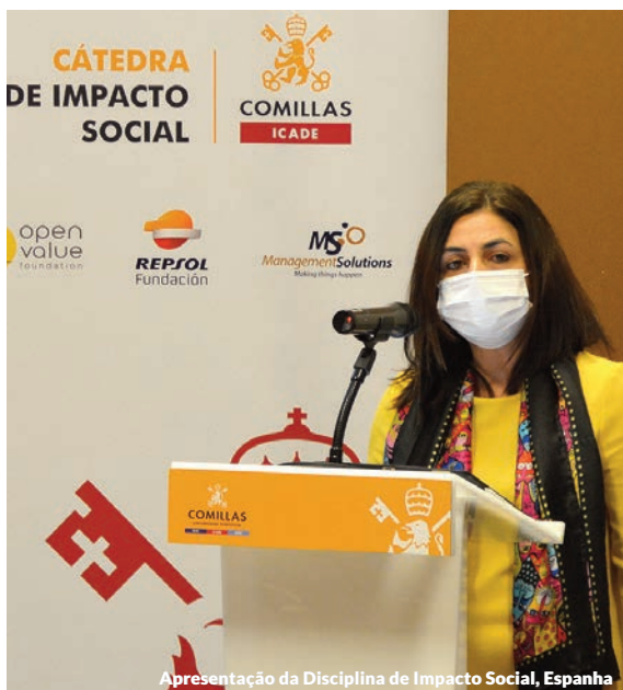
Apresentação da Disciplina de Impacto Social, Espanha

A Management Solutions foi convidada a participar da conferência on-line organizada pela RSU e Marcus Evans sobre Gestão de Risco Modelo (MRM) para representantes de instituições financeiras internacionais e seguradoras.