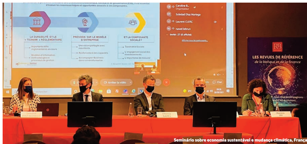
Seminário sobre economia sustentável e mudança climática, França

Management Solutions participou como palestrante no webinar "O novo regime de capital do FRTB CVA, um caminho