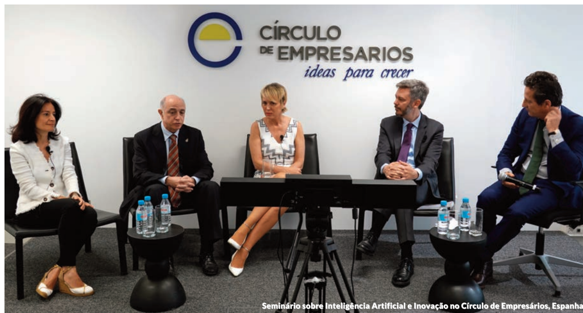
Seminário sobre Inteligência Artificial e Inovação no Círculo de Empresários, Espanha

Neste contexto, a Management Solutions organizou um webinar para compartilhar reflexões sobre as exigências e implicações de sua implementação, com um foco especial nas considerações a serem levadas em conta em termos de governança e mensuração de risco, estrutura de apetite de risco, exercícios de estresse, infraestrutura tecnológica e qualidade dos dados.