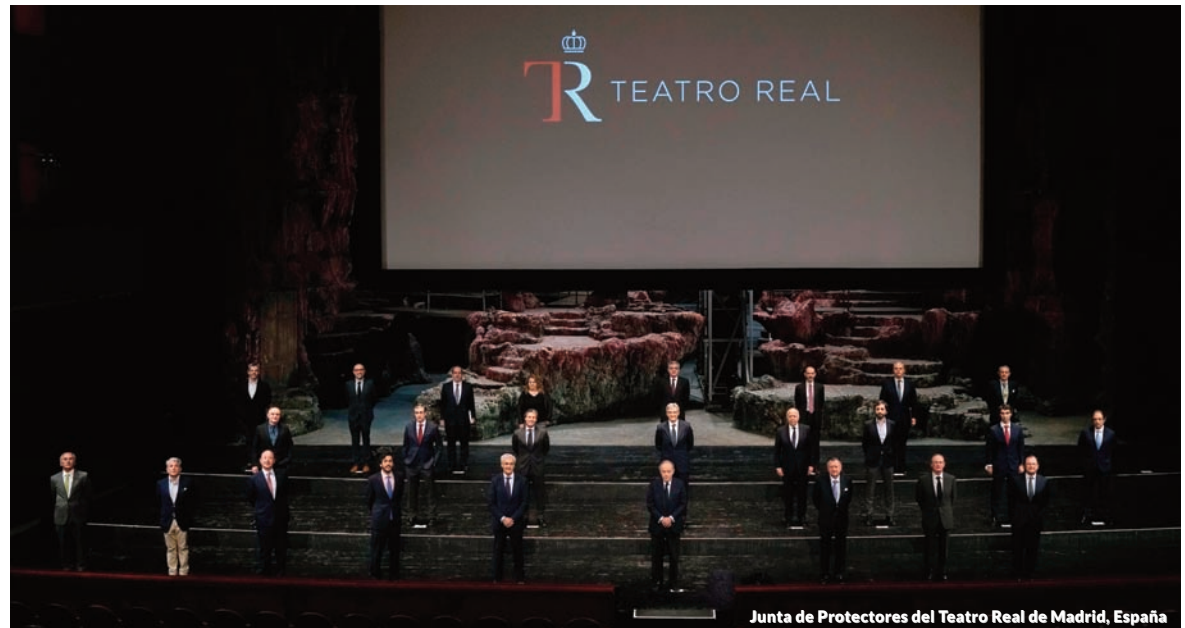
Junta de Protectores del Teatro Real de Madrid, España

Management Solutions participa como socio en el Club Español de la Energía (ENERCLUB), constituido como punto de encuentro, diálogo y difusión entre empresas y profesionales