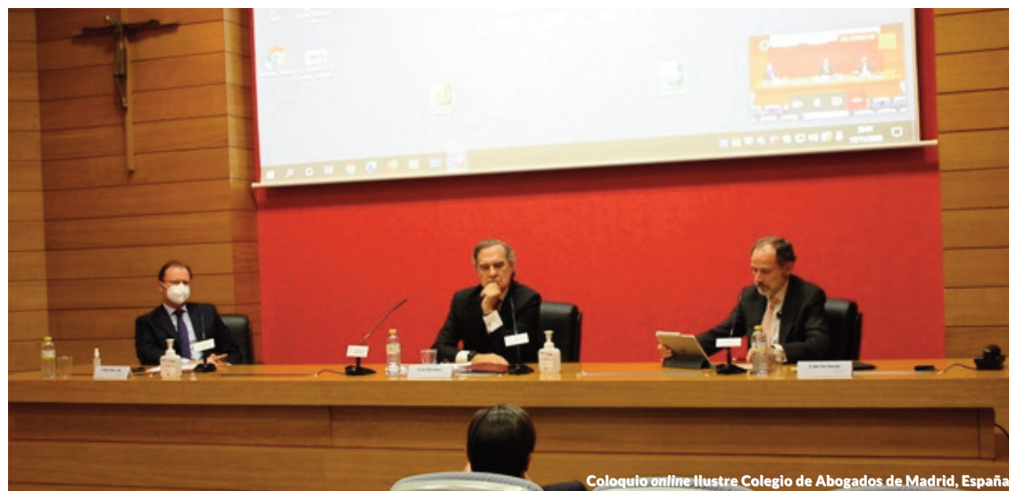
Coloquio online Ilustre Colegio de Abogados de Madrid, España