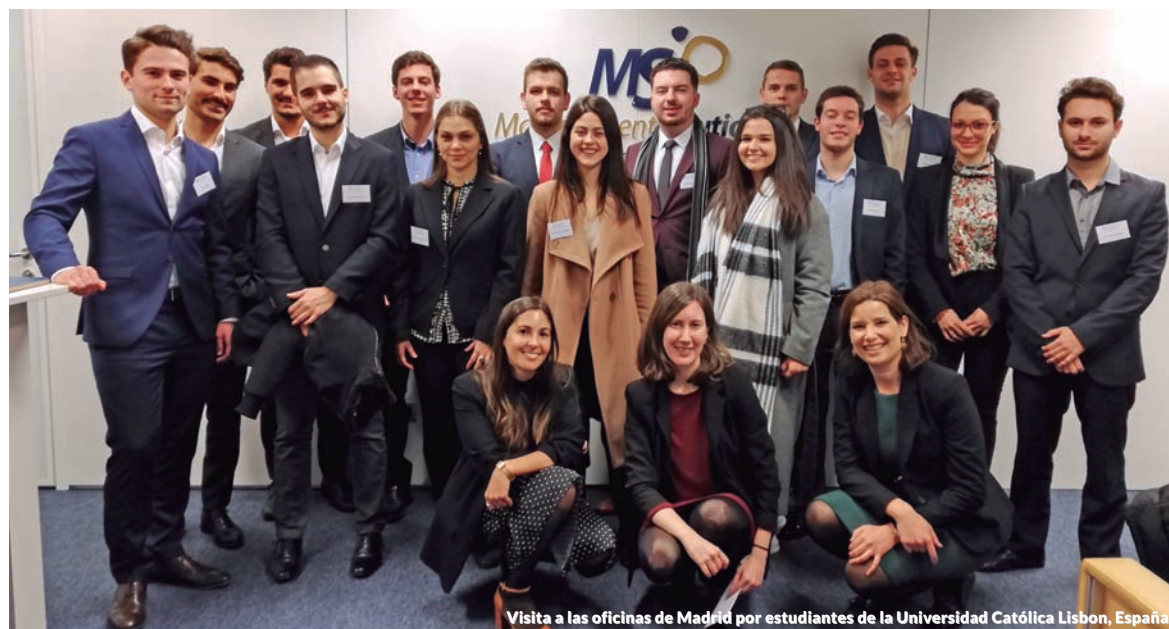
Visita a las oficinas de Madrid por estudiantes de la Universidad Católica Lisbon, España