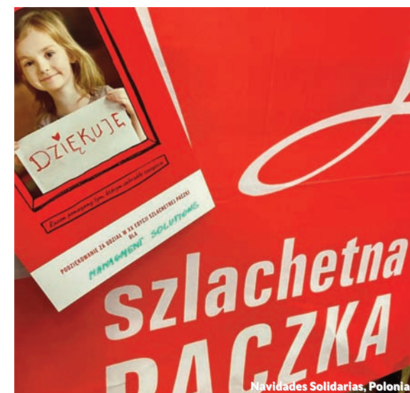
Navidades Solidarias, Polonia