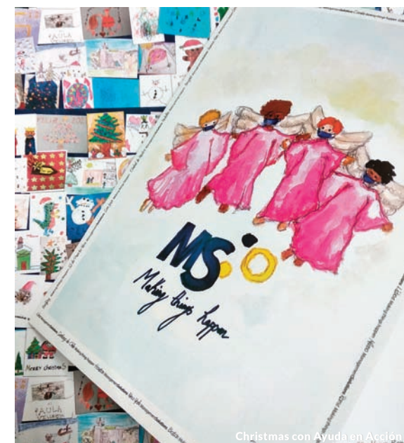
Christmas con Ayuda en Acción