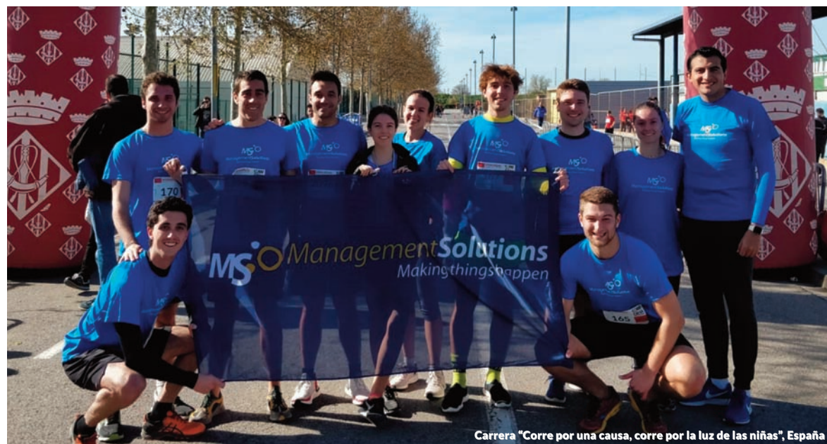
Carrera "Corre por una causa, corre por la luz de las niñas", España