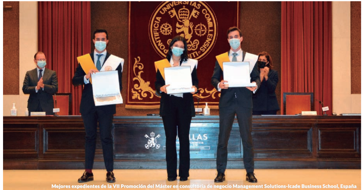
Mejores expedientes de la VII Promoción del Máster en consultoría de negocio Management Solutions-Icade Business School, España

Management Solutions contribuye a la transmisión del conocimiento Universidad - Empresa mediante convenios con