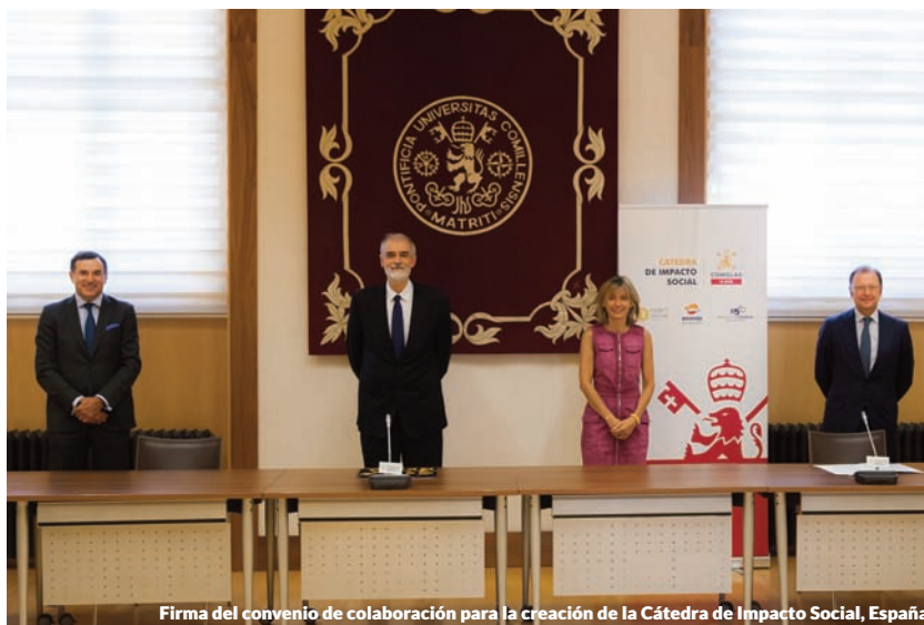
Firma del convenio de colaboración para la creación de la Cátedra de Impacto Social, España

La Cátedra, vinculada a la Facultad de Ciencias Económicas y Empresariales de la Universidad Pontificia Comillas, además de proporcionar espacios de debate y reflexión, y formación de profesionales especializados, creará un Laboratorio de Impacto Social, un think tank de conocimiento pionero en España. Este Laboratorio reunirá a un grupo de expertos para reflexionar sobre el futuro de la inversión, la medición de la contribución y los riesgos asociados a la misma y crear un Libro Blanco en la materia.