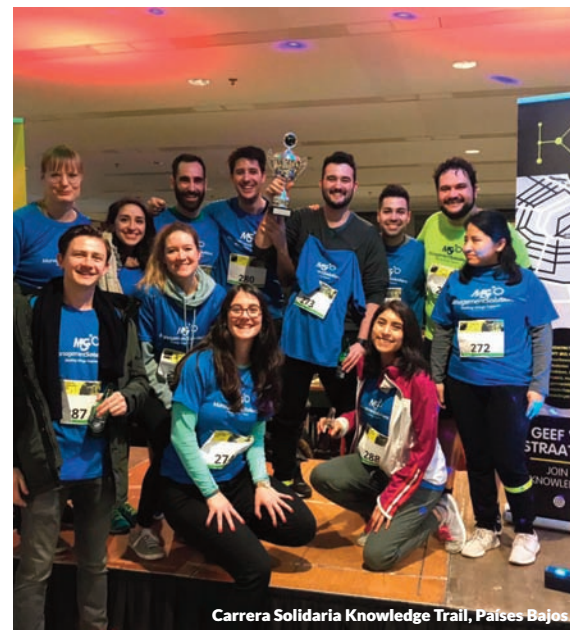
Carrera Solidaria Knowledge Trail, Países Bajos.

Un grupo de más de 20 profesionales de Management Solutions participó en Ámsterdam en la II edición de la carrera solidaria "Knowledge Trail", que colabora con la fundación Het Gehandicapte Kinds. El buen ambiente presidió la participación de los integrantes de Management Solutions, que participaban