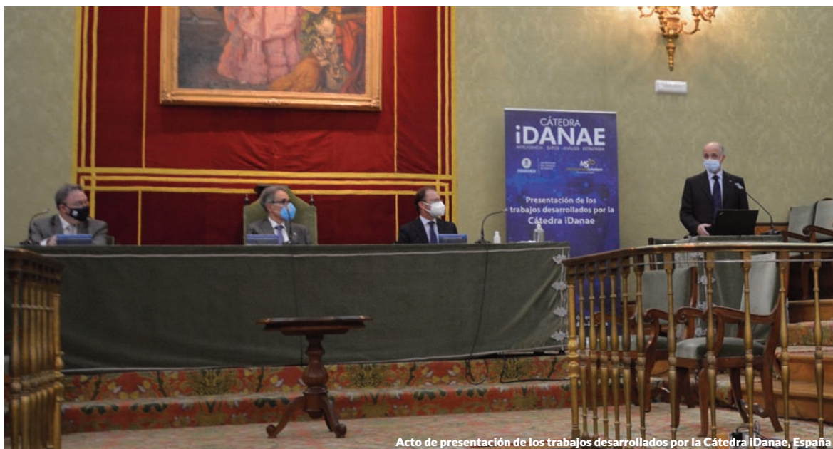
Acto de presentación de los trabajos desarrollados por la Cátedra iDanae, España

Por último, la publicación correspondiente al 4T20, trata sobre la causalidad en el ámbito de los modelos de Machine Learning y su impacto en el desarrollo de dichos modelos, profundizando en la importancia de aplicar conocimientos de causalidad a la Inteligencia Artificial para conseguir modelos con una capacidad de generalización mejorada, de forma que se descarten relaciones espurias y sesgadas.