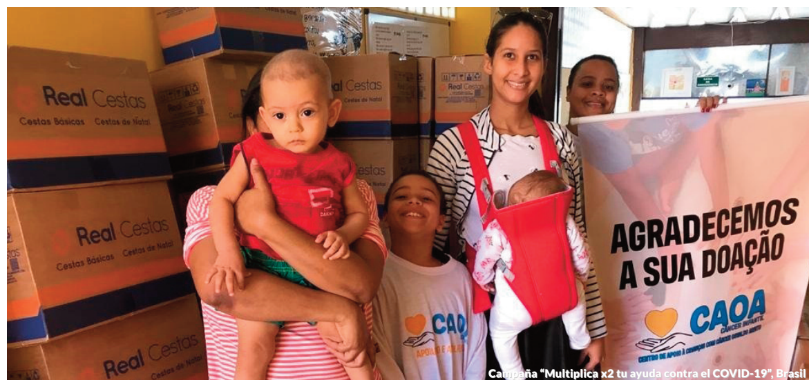
Campaña "Multiplica x2 tu ayuda contra el COVID-19", Brasil