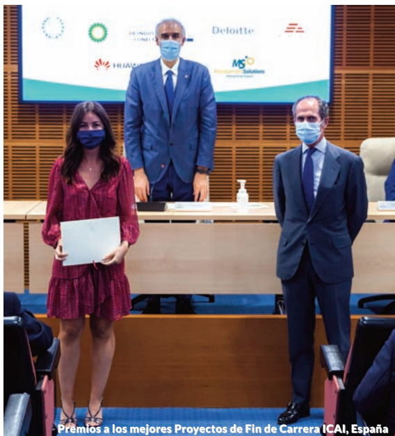
Premios a los mejores Proyectos de Fin de Carrera ICAI, España