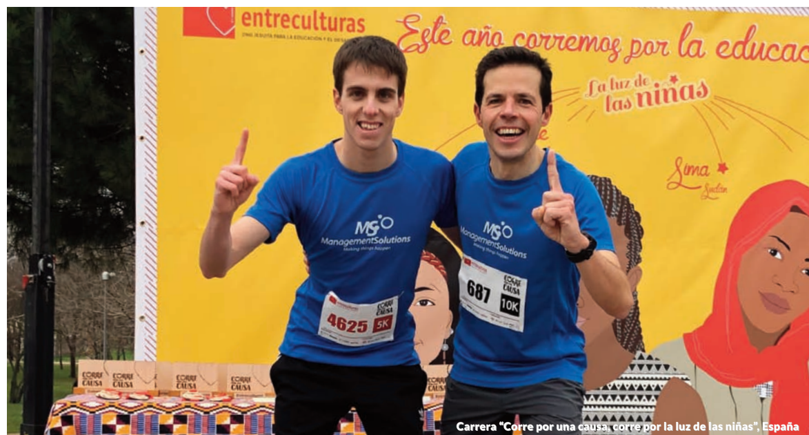
Carrera "Corre por una causa, corre por la luz de las niñas", España

Management Solutions México se sumó a la iniciativa #UnDíaSinMujeres, destinada a visibilizar la aportación de las mujeres en todos los ámbitos de la sociedad y a reclamar un México más justo, igualitario y sin violencia.