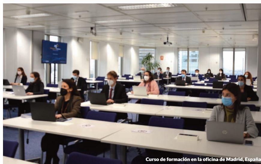
Curso de formación en la oficina de Madrid, España