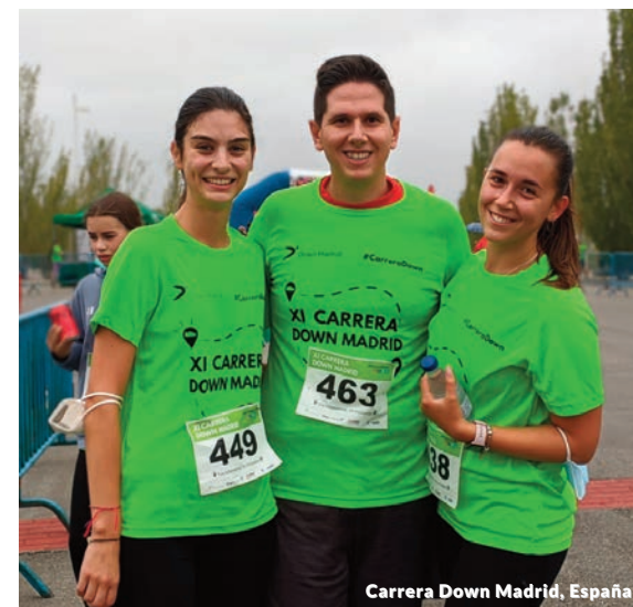
Carrera Down Madrid, España

Management Solutions quiso unirse a la conmemoración compartiendo a través de sus canales digitales el testimonio de