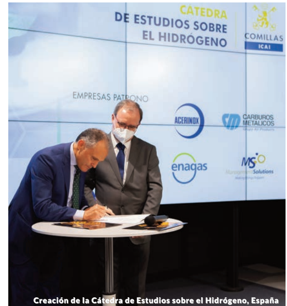
Creación de la Cátedra de Estudios sobre el Hidrógeno, España

Solutions, destacó que “se dispone ya de tecnología, y tendremos fondos europeos y reformas, para que el Hidrógeno pueda jugar un papel clave en la descarbonización masiva y realista con efectos muy beneficiosos también en la economía y el empleo en muchos colectivos y territorios. Management Solutions reafirma su compromiso con la innovación y con la universidad en materias de amplio interés social y colaborará intensamente con la Cátedra en la investigación en ámbitos económicos, de gestión y regulatorios, así como en la posterior aplicación práctica y efectiva a proyectos de transformación empresarial sostenible”.