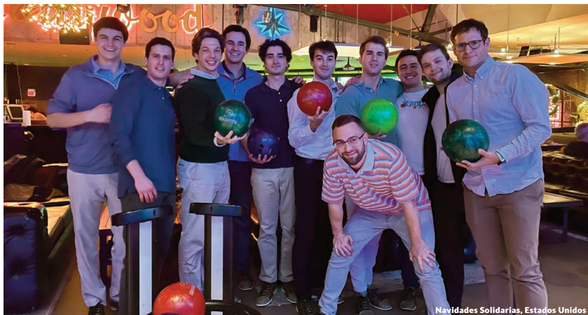
Navidades Solidarias, Estados Unidos

La AECC es una ONG constituida en 1953 que integra en su seno a pacientes, familiares, personas voluntarias y profesionales que trabajan unidos para prevenir, sensibilizar, acompañar a las personas, y financiar proyectos de investigación oncológica que permitirán un mejor diagnóstico y tratamiento del cáncer.