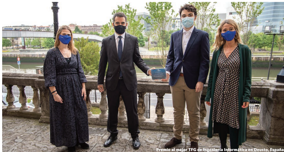
Premio al mejor TFG de Ingeniería Informática en Deusto, España