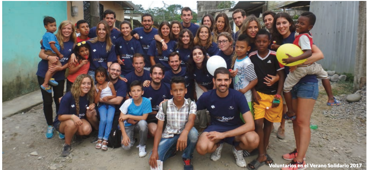
Voluntarios en el Verano Solidario 2017

La Firma apoya y fomenta las actuaciones solidarias desarrolladas por sus profesionales