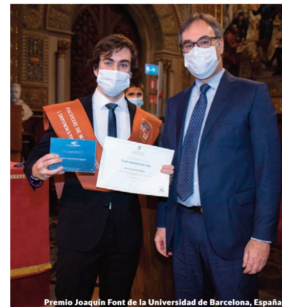
Premio Joaquín Font de la Universidad de Barcelona, España