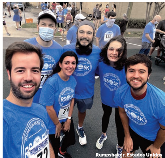
Rumpshaker, Estados Unidos