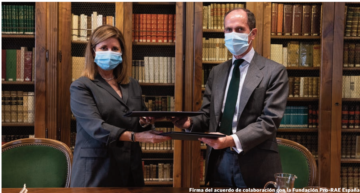
Firma del acuerdo de colaboración con la Fundación Pro-RAE España

Dicho Instituto tiene como principales finalidades representar a sus miembros en cuantas cuestiones se relacionan con su actividad actuarial, organizar e impulsar toda clase de estudios y actividades relacionadas con la profesión de actuario, colaborar con los organismos y autoridades competentes siempre que para ello sea requerido, regular la actividad profesional que, en todo caso, se ajustará a los más exigentes principios científicos y éticos, ejercer tutela, protección y vigilancia sobre las actividades profesionales de los miembros del Instituto, dirimir las