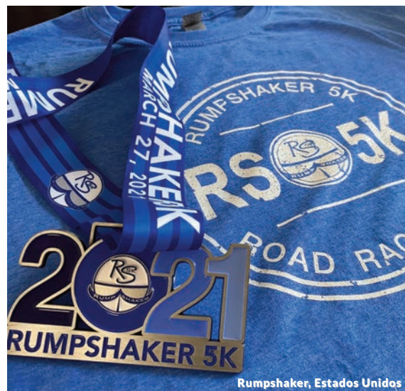
Rumpshaker, Estados Unidos

11 profesionales de Management Solutions participaron en la carrera Rumpshaker 2021 organizada en Birmingham con el objetivo de recaudar fondos en favor de Rumpshaker, una organización sin ánimo de lucro cuya misión es concienciar sobre el cáncer de colon y recaudar fondos para combatirlo y tratarlo, así como dar apoyo a las personas que han superado la enfermedad y a los que todavía luchan contra ella.