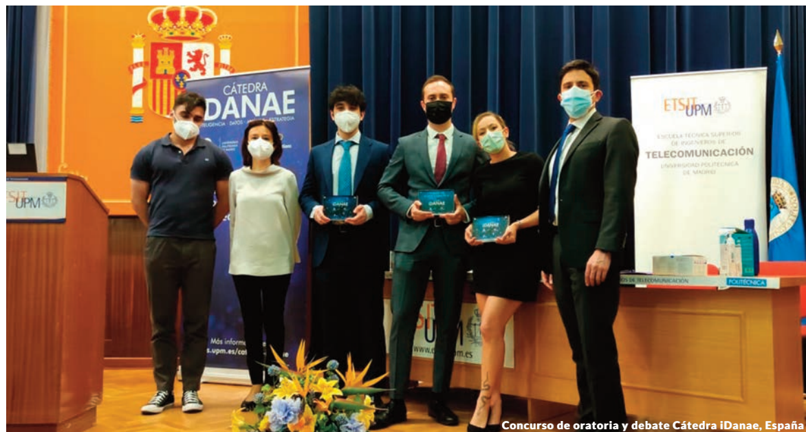
Concurso de oratoria y debate Cátedra IDanae, España

Las funciones del consejo incluyen, entre otras, analizar el contenido y las habilidades de programas para determinar su efectividad y valor; ayudar a identificar las habilidades de empleabilidad requeridas por el mercado laboral; apoyar y sustentar los estándares de calidad y las competencias de los programas; evaluar la relevancia y eficacia de los programas en satisfacer necesidades económicas y sociales; evaluar los espacios, los equipos y las instalaciones físicas para contribuir a su mejora; contribuir a facilitar intercambios internacionales y promover becas; patrocinar proyectos de investigación; proporcionar conferenciantes, equipo y material instructivo, y ayudar con el desarrollo general de las carreras profesionales de los estudiantes.