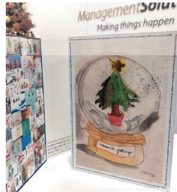
Christmas con Ayuda en Acción