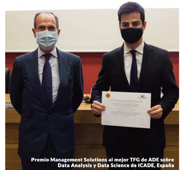
Premio Management Solutions al mejor TFG de ADE sobre Data Analysis y Data Science de ICADE, España