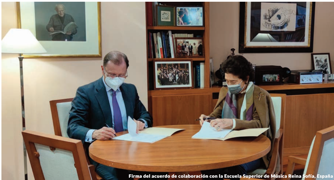
Firma del acuerdo de colaboración con la Escuela Superior de Música Reina Sofía, España

Este convenio subraya la importancia de la música de conjunto en la formación de un músico como complemento indispensable a su destreza como solista y participación en orquesta. Asimismo, subraya la apuesta de Management Solutions por valores compartidos como la calidad, el esfuerzo y el desarrollo del talento, así como su incondicional apoyo a las artes y la música.