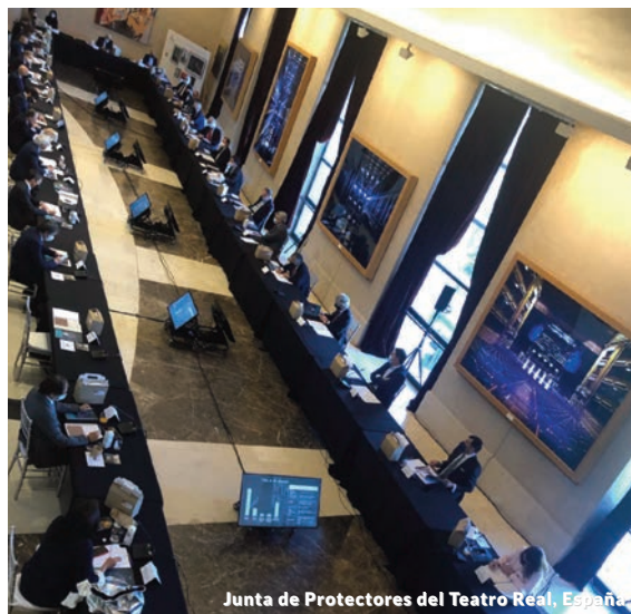
Junta de Protectores del Teatro Real, España

Gracias al apoyo y aportación económica de los socios, ha sido posible el desarrollo de su actividad a lo largo de más de veinte años en torno a cuatro grandes áreas: conocimiento energético, formación, publicaciones y difusión online .