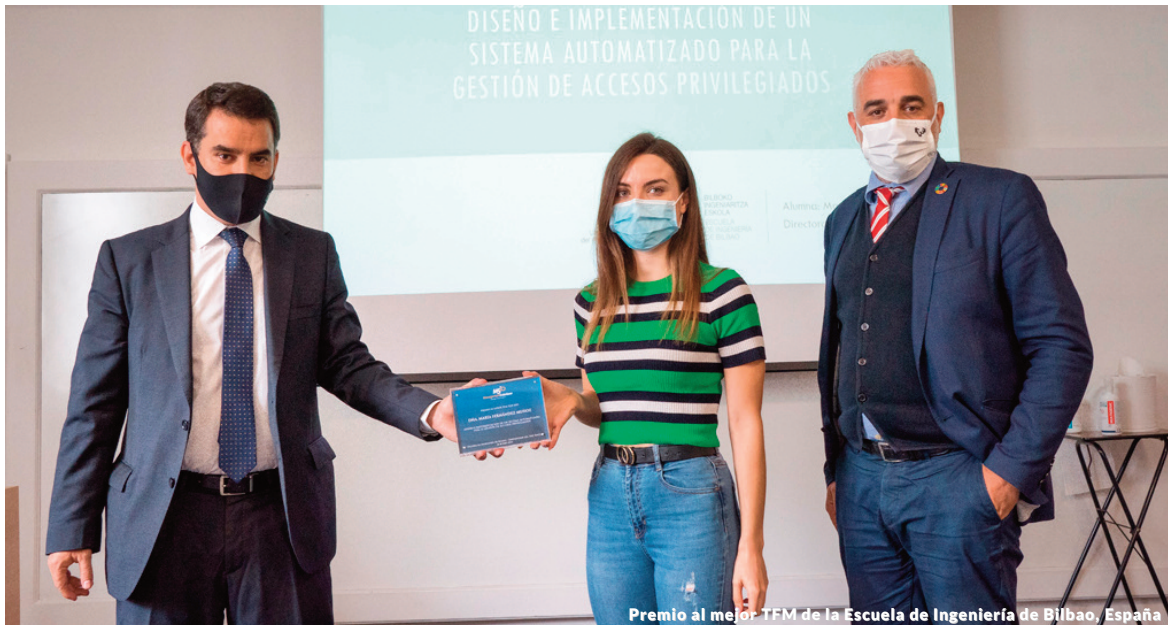
Premio al mejor TFM de la Escuela de Ingeniería de Bilbao, España

El programa "LSE Careers Patrons", en el que participan cerca de 30 empresas líderes en sus respectivos sectores, tiene como objetivo servir como punto de contacto entre el mundo universitario y el empresarial, facilitando la organización de eventos de networking con estudiantes y alumni , seminarios especializados, el acceso a ofertas de empleo, etc. Además, gracias a las aportaciones de las empresas participantes en el programa, la LSE puede seguir manteniendo algunos de los programas que ofrece a su comunidad, como el centro de voluntariado.