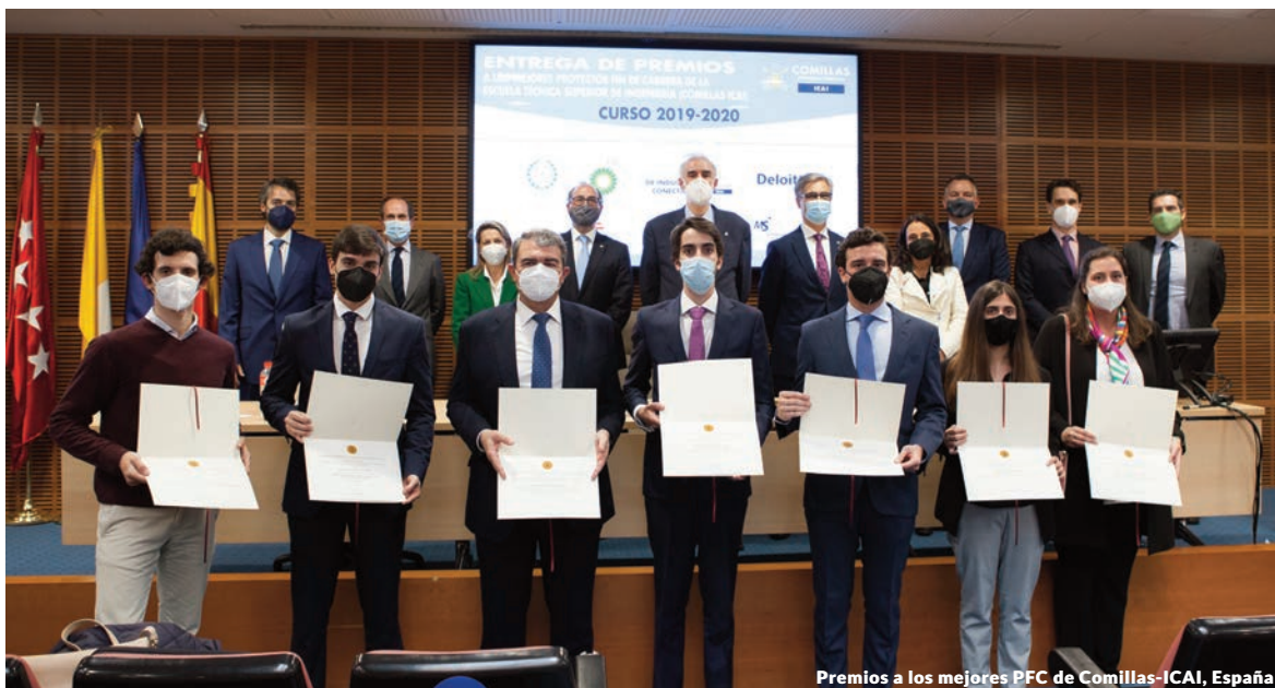
Premios a los mejores PFC de Comillas-ICAI, España